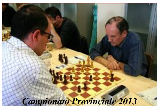
Campionato Provinciale 2013