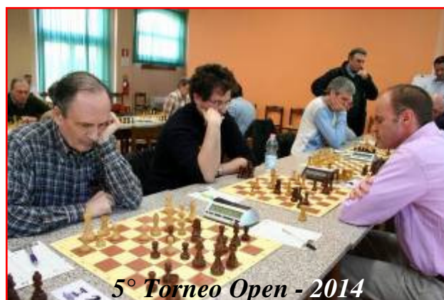
5° Torneo Open - 2014