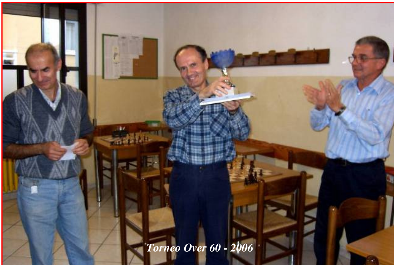
Torneo Over 60 - 2006