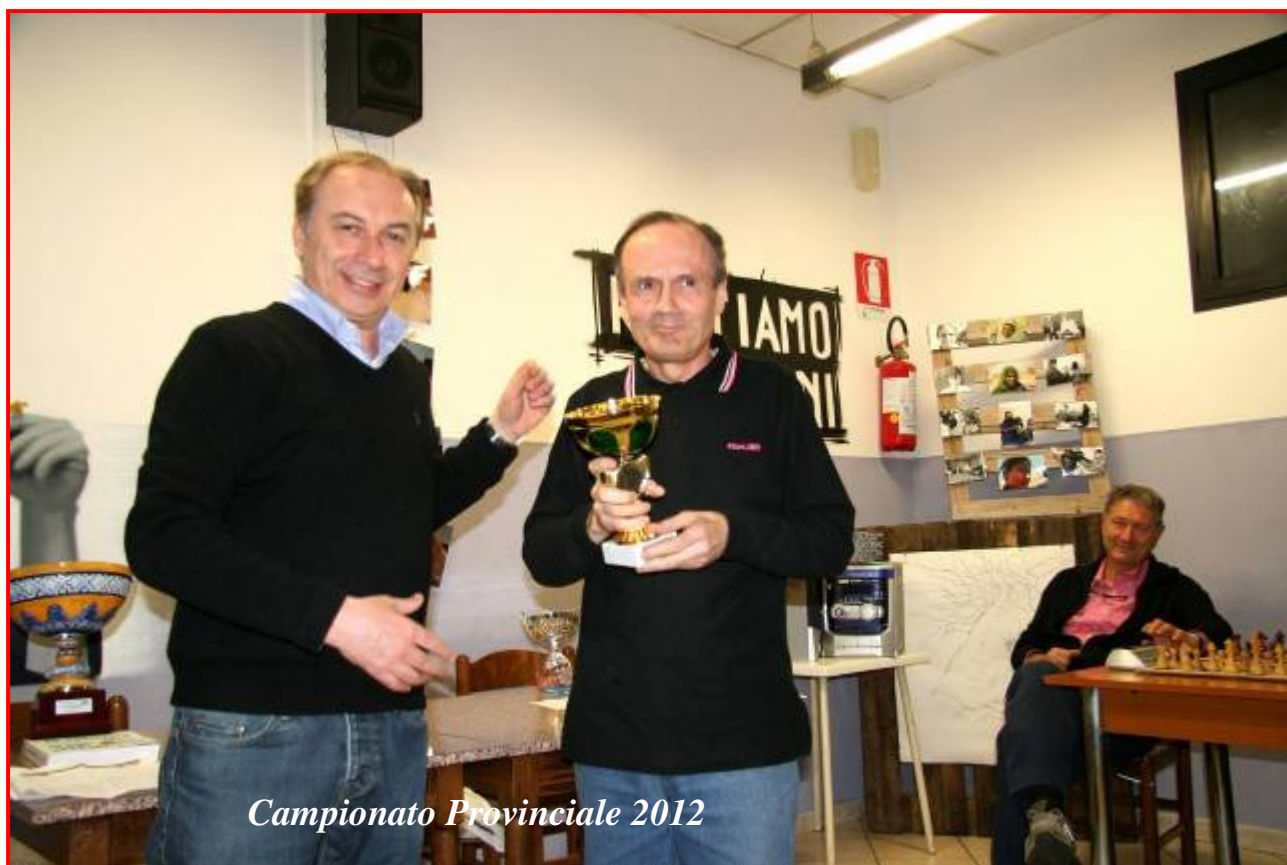
Campionato Provinciale 2012